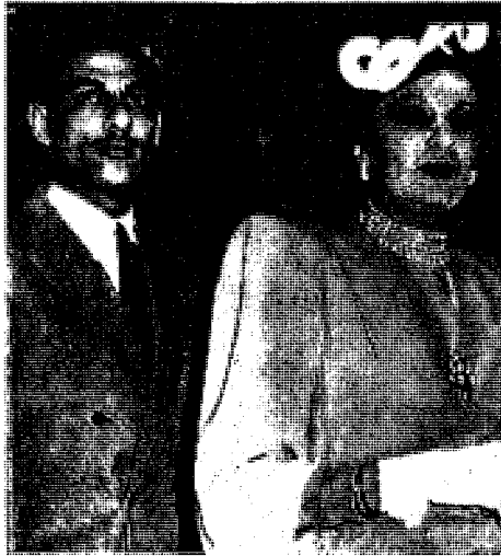
الملكة نازلى ورياض غالى فى أمريكا قبل زواجه من إبنتها الأميرة فتحية